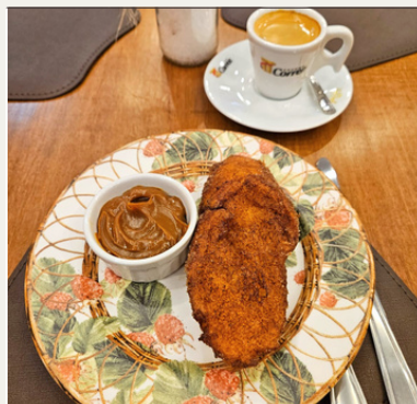
RABANADA + CAFÉ