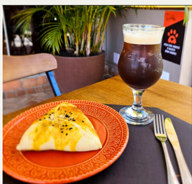
ESFIRRA + MATE DA CASA