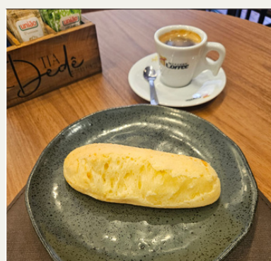
PÃO DE QUEIJO + CAFÉ