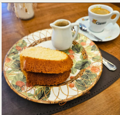
BOLO DO DIA + CAFÉ

Pão de Queijo + Café Espresso 30ml | R$ 12,90